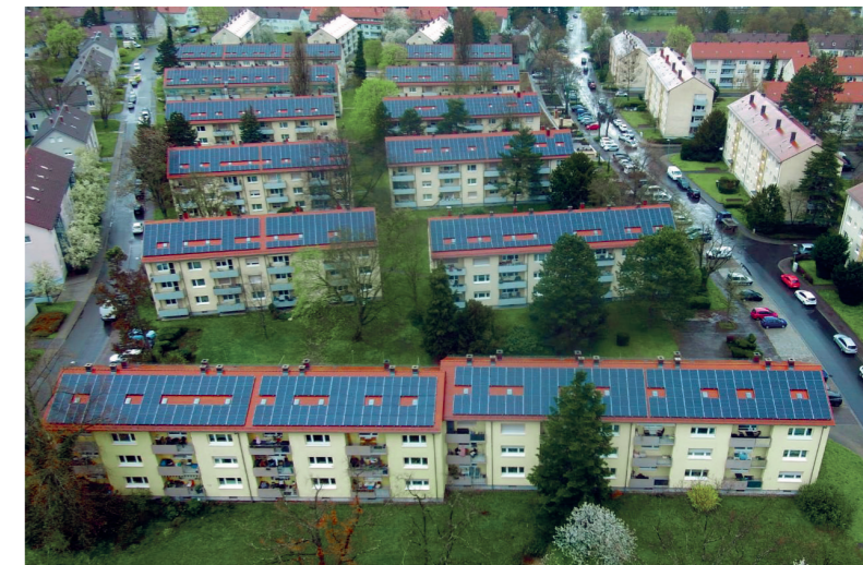
Luftaufnahme der Rheinstrandsiedlung

Wir behalten insbesondere die langfristige Rentabilität im Auge. Die anfänglich hohen Investitionskosten für die Installation von Solaranlagen amortisieren sich über die Jahre durch die eingesparten Energiekosten oder zusätzliche Einnahmen. Photovoltaikanlagen haben eine lange Lebensdauer und erfordern nur minimale Wartung, was ihre Wirtschaftlichkeit langfristig sicherstellt. Denn Nachhaltigkeit funktioniert nur, wenn sie auch wirtschaftlich sinnvoll ist.